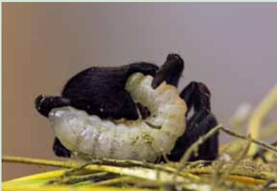
Figuur 4. Op 5 september 2010 is de larve al 14 mm groot.

In 2010 is bij het verplaatsen van de vuurspinnen bijgehouden welk deel van de spinnen volwassen was. Bij de 512 verzamelde spinnen waren 59 adulte mannetjes en 68 adulte vrouwtjes. Van deze volwassen vrouwtjes bleken vier exemplaren geparasiteerd (drie spinnendoderlarven en een cocon). Ervan uitgaande dat het bij de verzamelde spinnen om een redelijk aselechte steekproef gaat, bedraagt het parasiteringspercentage van de volwassen vrouwtjes zo'n 6% en van de populatie als geheel circa 1%.