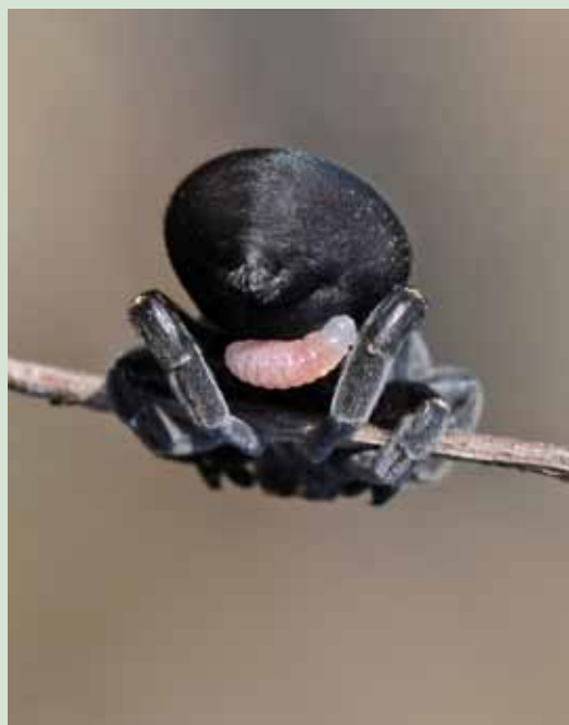
Figuur 3. Larve van de Vuurspinnendoder (4 mm) op een Eresus -wijfje, 28 augustus 2010.