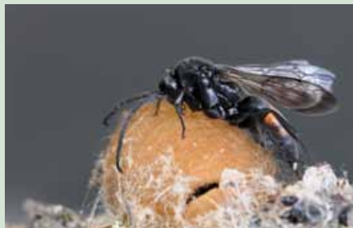
Figuur 2. Uitgeslopen mannetje Vuurspinnendoder op zijn cocon, 6 juni 2010.

Uitgaande van Rezac et al. 2008, die aangeven dat eicocons in juni worden geproduceerd (wat bij ons ook het geval lijkt te zijn), fungeren van de volwassen vrouwtjes alleen de ongepaarde volwassen individuen die nog eenmaal overwinteren als gastheer. Na paring in het voorjaar blijven de vrouwtjes weliswaar nog tot ver in de vliegtijd van de Vuurspinnendoder in leven, maar zodra hun eieren uitkomen, sluiten zij hun nestpijp hermetisch af en dienen ze uiteindelijk als voedsel voor hun jongen. Dit afsluiten van hun nestgang vindt plaats voor de start van de vliegtijd van de spinnendoder, waardoor ze voor de spinnendoders onbereikbaar zijn.