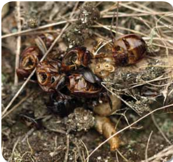
Figuur 4. Prooi-resten, waaronder verschillende gedeeltelijke exoskeletten van mestkevers, op het web.

aangetroffen. Studie van de prooi-resten bracht aan het licht dat de beet van de Lentevuurspin krachtig genoeg is om de harde dekschilden van deze kevers te perforeren (Walraven 2011). De jongste generatie start het eerste zelfstandige levensjaar met wat spinsel in de strooisellaag en zal zich dan tevreden stellen met veel kleinere prooien, zoals mieren.