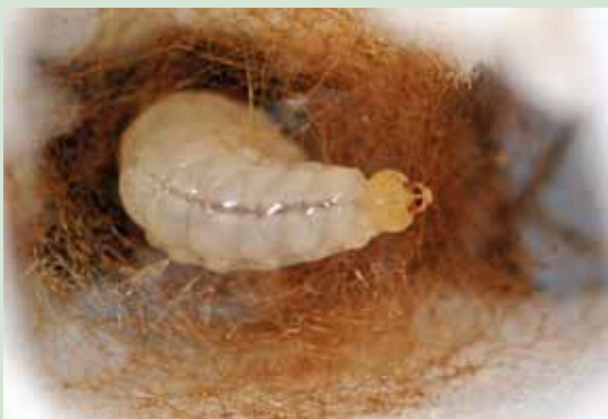
Figuur 6. Uit de ontstane uitstulping onder de kaken wordt de spindraad geproduceerd.