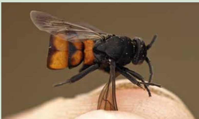
Figuur 1. Wijfje Vuurspinnendoder als prooi van Lentevuurspin.

In 2009 werd bij het Limburgse Lommel een Vuurspinnendoder Eoferreola rhombica aangetroffen. Deze vondst van een nieuwe soort voor de Belgische fauna was zeer onverwacht. De gastheren van deze spinnendoder, te weten vuurspinsoorten Eresus spp., waren tot dan toe slechts incidenteel voor België gemeld, met slechts één zekere opgave uit 1896. De waarneming van de eerste Vuurspinnendoder volgde echter op de herontdekking van de Lentevuurspin Eresus sandaliatus . Inmiddels is in Lommel een levensvatbare populatie Vuurspinnendoders vastgesteld en dat terwijl de soort in Midden-Europa uiterst zeldzaam is en pas recent voor het eerst in Noordwest-Europa werd aangetroffen. Helemaal zal de kern van het leefgebied tot bedrijventerrein worden omgevormd.