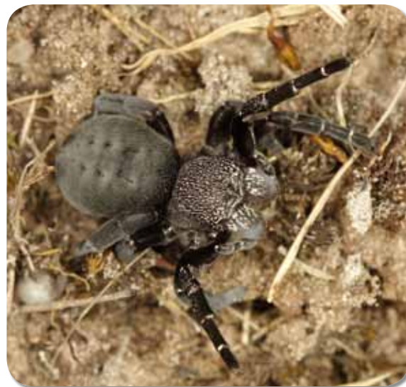
Figuur 1. De Lentevuurspin: volwassen vrouwtje.

Waar spinnen bij een overgroot deel van de bevolking nog vooral afkeer opwekken, hebben zowel de mannetjes als de vrouwtjes van de Lentevuurspin hun uiterlijk helemaal mee. Vooral de volwassen mannetjes spreken tot de verbeelding. Hun achterlijf is bedekt met felrode of oranje beharing, waar-tussen zich vier tot zes zwarte vlekken bevinden. Die kleurtkening doet wat denken aan lieveheersbeestjes en de Engelsen noemen de soort dan ook Ladybird Spider ('lieveheersbeestjes-spin'). Zijn poten hebben bovendien een mooie zwart-witte ringtekening, die iemand ooit vergeleek met 'voetbalkousen'. Dat uiterlijk maakt de mannetjes voor vele mensen waarschijnlijk tot de mooiste inheemse spinnen. Het vrouwtje is van een meer discrete schoonheid (Figuur 1). Zij lijkt bedekt met een