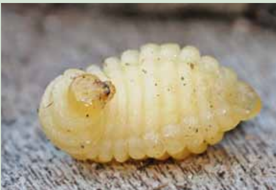
Figuur 7: De Vuurspinnendoder overwintert zo goed als zeker als larve.

Bij de spinnenverplaatsing in 2009 is het aantal volwassen spinnen niet geteld, maar van de 280 verplaatste spinnen bleken er drie geparasiteerd. Ook in 2009 was het parasiteringspercentage binnen de spinnenpopulatie als geheel ongeveer 1% en aannemende dat het aandeel volwassen spinnenvrouwtjes jaarlijks ongeveer hetzelfde is, zou dus ook de parasiteringsgraad van volwassen vrouwtjes zo'n 5 tot 10% hebben bedragen.