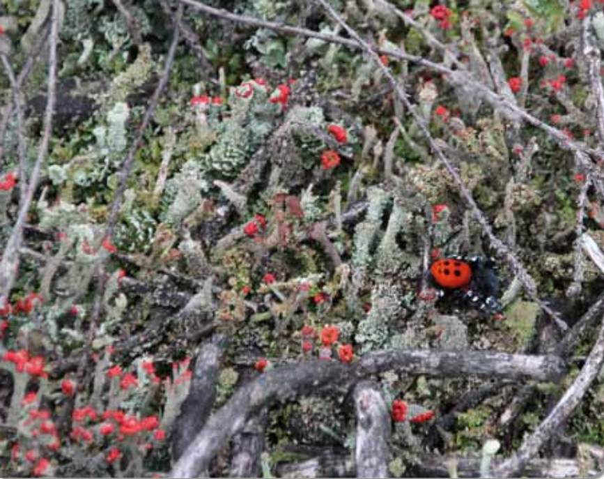
Figuur 7. Een dolend mannetje tussen Rood bekersmos. Camouflage?

De meeste van onze spinnensoorten verspreiden zich als ze jong zijn door 'ballooning' (het zich via een draad laten meedrijven met de wind). De Lentevuurspin past deze verspreidingstechniek echter niet toe (Rezac et al. 2008). Mogelijk zijn de jongen hierin beperkt doordat ze bij het verlaten van het moedernest reeds te zwaar zijn. Een beperkte mogelijkheid tot verspreiding zorgt ervoor dat elementen zoals brand, het ongeschikt worden van habitat door te hoge recreatiedruk, verkeerd beheer of gewoon 'natuurlijke' evoluties zoals vergrassing of bomenopslag nefaste gevolgen hebben voor de plaatselijke populatie. Die zit dan namelijk 'gevangen' en sterft uit. Zelfs wanneer een geïsoleerd gebied na het verdwijnen van de soort terug geschikt wordt als habitat, is nieuwe kolonisatie door de Lentevuurspin problematisch (Baumann 1997, Hendrickx et al. 2011). In de huidige praktijk komt het er dus op neer dat het bestaande verspreidingsgebied van de soort in Vlaanderen enkel kan inkrimpen. Een hachelijke realiteit die ervoor kan zorgen dat het verdwijnen van de Lentevuurspin wel eens heel snel zou kunnen volgen op haar herontdekking.