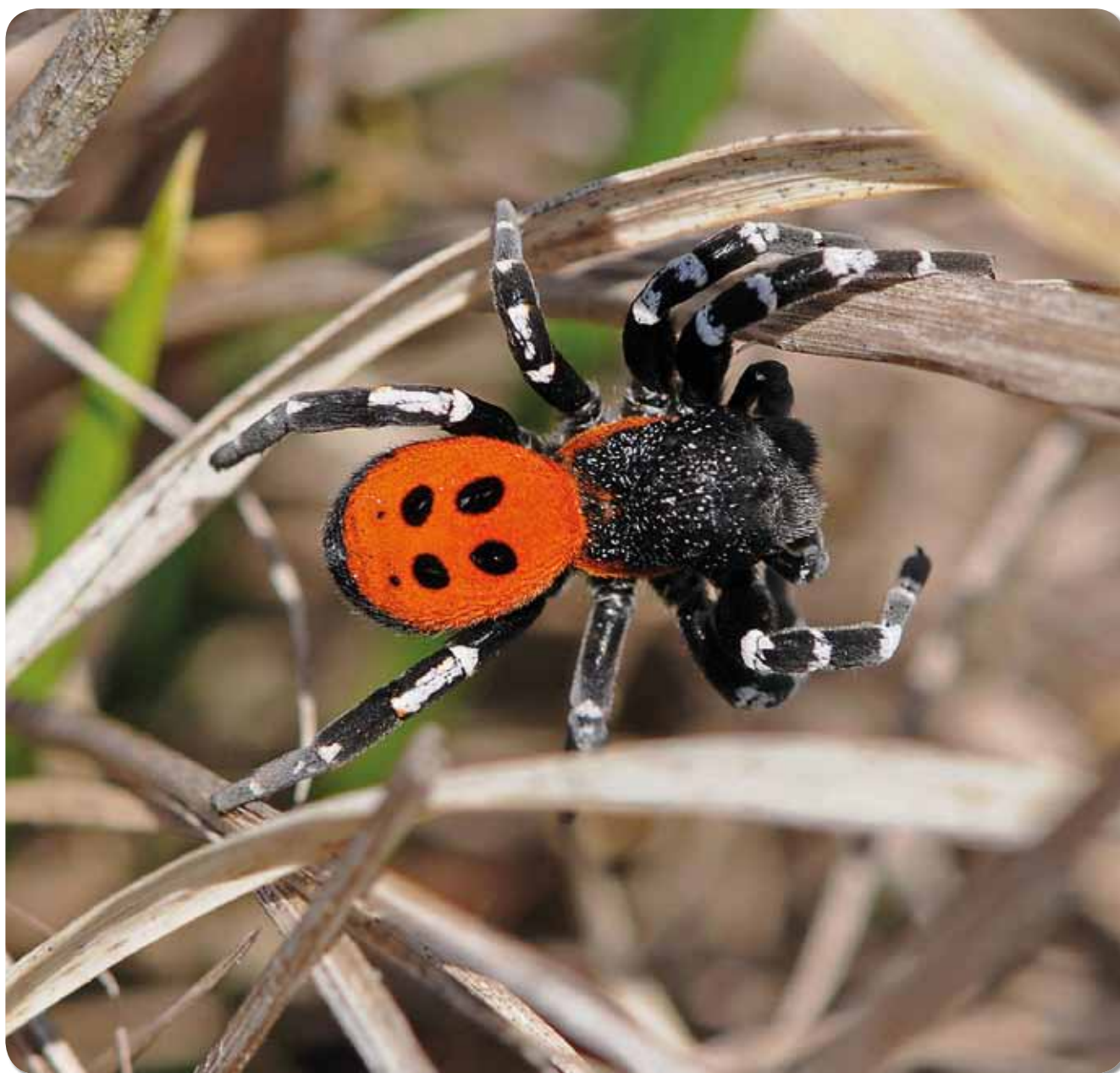
De Lentevuurspin: dolend mannetje op zoek naar een vrouwtje.

Soms is er ook goed nieuws te melden van het natuurfront. Al meer dan honderd jaar zochten Belgische arachnologen naar de bijna mythisch geworden Lentevuurspin Eresus sandaliatus . Verschillende mensen beweerden haar gezien te hebben, maar nooit kon een bewijs geleverd worden. Het leverde haar de bijnaam 'Monster van Loch Ness onder de Belgische spinners' op. Tot op 20 mei 2009 een speciaal daarvoor ingerichte Arabel-expeditie naar het Limburgse Lommel één exemplaar van de soort oplevert. Het is de start van een bewogen verhaal.