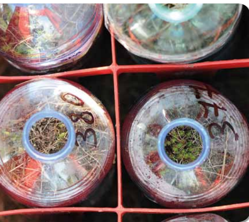
Figuur 9. Prefabbehuizing in petflessen.

Zonder maatregelen zal op Balim Gronden de hele aanwezige megapopulatie verdwijnen zodra het gebied verder ontgonnen wordt voor industriële bebouwing. Om die reden zijn Levend Zand, ANB en Arabel een translocatieproject gestart. Doel is om de soort te (her)introduceren in enkele met zorg geselecteerde terreinen in de directe omgeving, die op termijn bij voorkeur met elkaar verbonden zouden worden. Belangrijke beweegredenen die dit project verantwoorden zijn de acute situatie, het feit dat de soort door de combinatie van haar zeer beperkte dispersiecapaciteit en de isolatie van geschikte leefgebieden door landschapsversnippering volledig van de mens afhankelijk is geworden voor haar verspreiding en de huidige precare situatie ook door toedoen van de mens is ontstaan. Bovendien is een pluspunt dat de projectspinnen uit de regio zelf afkomstig zijn en slechts over korte afstand worden verplaatst.