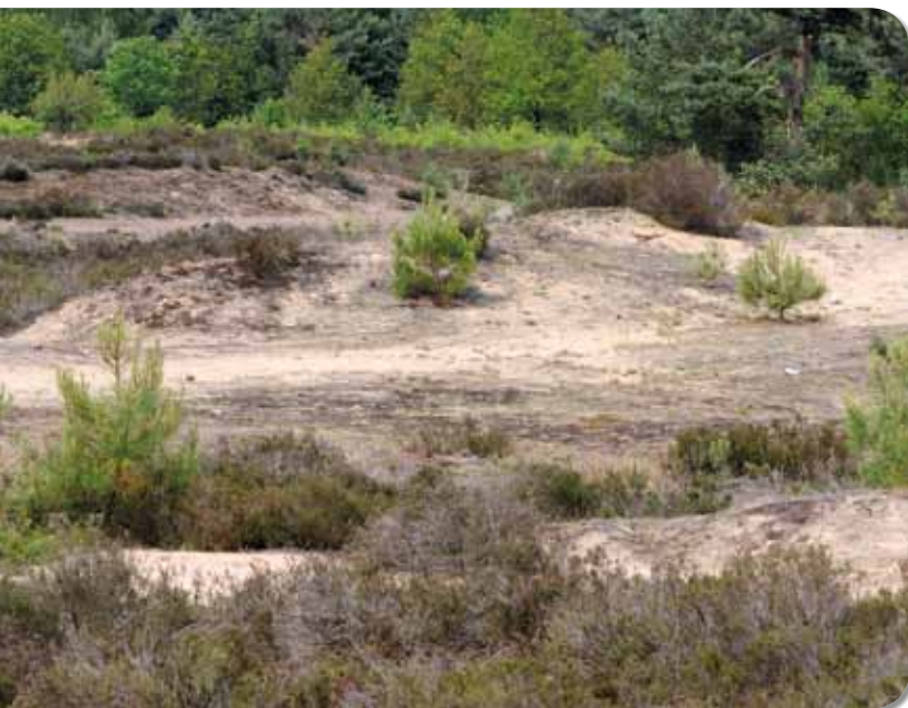
Figuur 6. Typische biotoop van de Lentevuurspin.

De biotoop, zoals die doorgaans in de literatuur beschreven wordt, luidt: droge heide op voedselarme zandgronden met open plekken en korstmosbegroeiing. Daar is de spin veelal te vinden op zuidgerichte hellingen en bij voorkeur tegen de grens met hogere vegetatie, zoals bomen en struiken (Figuur 6). Die zorgen voor beschutting tegen wind (Bellman 2006, Bristowe 1958, Maelfait et al. 1998, Rezac et al. 2008). De genoemde korstmosbegroeiing bestaat hoofdzakelijk uit Rood bekermos Cladonia coccifera . We vermoeden dat de rode kleur van de vruchtlichamen een zekere camouflerende bescherming biedt aan de rondwalende mannetjes (Figuur 7).