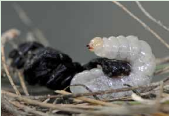
Figuur 5. Op 7 september 2010, na 'de grote slurp' is de larve 16 mm groot.