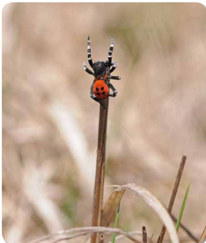
Figuur 3. Het mannetje zoekt een hoogte op en probeert daar met organen op zijn voorste poten vrouwelijke feromonen op te vangen.

De jongen verlaten in het voorjaar het nest en vestigen zich dan in de onmiddellijke omgeving, soms zelfs maar enkele centimeters verwijderd van het moedernest, wat tot een soort heksenkring-effect leidt. Zoals verder in dit artikel zal blijken, heeft die beperkte dispersiecapaciteit enorme consequenties voor het overleven van de soort.