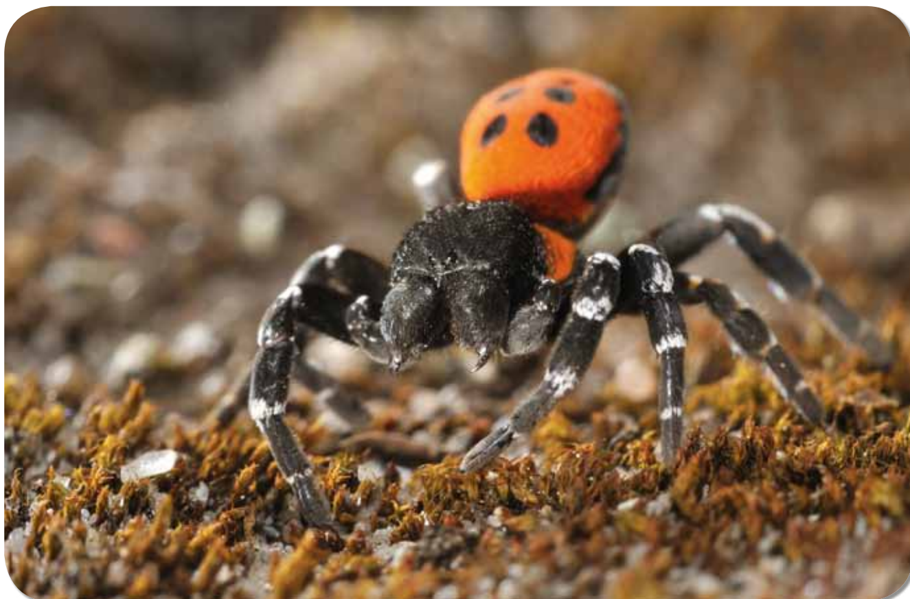
Figuur 5. Het mannetje in dreighouding.

En tot slot is er de mens in de rol van vijand. Er blijkt een weliswaar marginaal handeltje te bestaan in de verkoop van deze spinnensoort via het internet. Daarbij worden prijzen tot