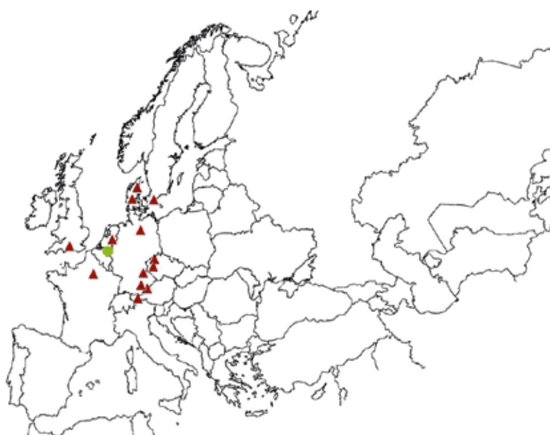
Figuur 8. Voorkomen van de Lentevuurspin (naar Rezac et al. 2008). In groen de recent ontdekte Belgische populatie.

De meeste van onze spinnensoorten verspreiden zich als ze jong zijn door 'ballooning' (het zich via een draad laten meedrijven met de wind). De Lentevuurspin past deze verspreidingstechniek echter niet toe (Rezac et al. 2008). Mogelijk zijn de jongen hierin beperkt doordat ze bij het verlaten van het moedernest reeds te zwaar zijn. Een beperkte mogelijkheid tot verspreiding zorgt ervoor dat elementen zoals brand, het ongeschikt worden van habitat door te hoge recreatiedruk, verkeerd beheer of gewoon 'natuurlijke' evoluties zoals vergrassing of bomenopslag nefaste gevolgen hebben voor de plaatselijke populatie. Die zit dan namelijk 'gevangen' en sterft uit. Zelfs wanneer een geïsoleerd gebied na het verdwijnen van de soort terug geschikt wordt als habitat, is nieuwe kolonisatie door de Lentevuurspin problematisch (Baumann 1997, Hendrickx et al. 2011). In de huidige praktijk komt het er dus op neer dat het bestaande verspreidingsgebied van de soort in Vlaanderen enkel kan inkrimpen. Een hachelijke realiteit die ervoor kan zorgen dat het verdwijnen van de Lentevuurspin wel eens heel snel zou kunnen volgen op haar herontdekking.